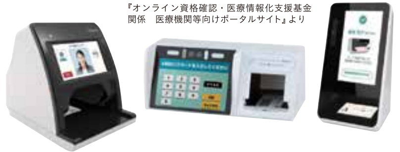
『オンライン資格確認・医療情報化支援基金関係 医療機関等向けポータルサイト』より