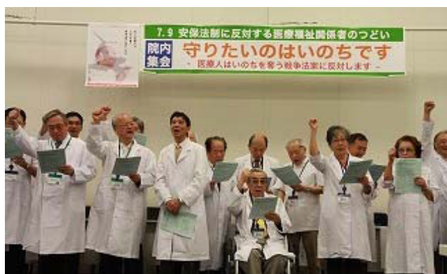
総行動で平和を守ろう！コールをする様子

7月9日、国会内で戦争法案に反対する医療人300人が集まり、総行動・リレートークを行いました。以下、発言内容を紹介します。